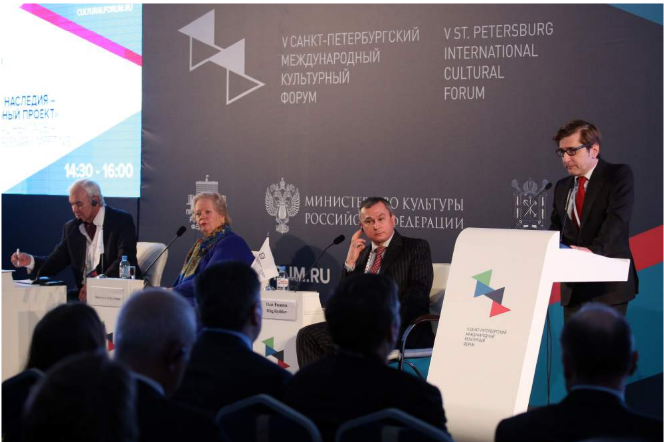
Il Console Generale Leonardo Bencini durante l'intervento alla riunione plenaria "Conservazione del patrimonio culturale – progetto prioritario nazionale"

Su questa foto (primo nella fila da destra) : Oleg Ryzhkov, Direttore dell'Agenzia per la gestione e la valorizzazione dei monumenti storico-culturali della Federazione Russa, curatore della sezione del Forum dedicata alla tutela del patrimonio culturale